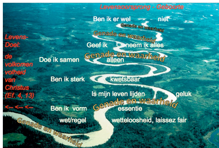
De Levensstroom (Jezus) is vol van genade en waarheid. Zo kun, daarin badend, je verder laten meestromen naar Gods volheid

Wat je met Jezus mag doen is weer in de Levensstroom terugkeren (Hij is die Weg, die Stroom) en dan op al die moeilijke punten onder ogen zien wat er is. En dat "onder de heerschappij brengen" van Zijn genade en waarheid (zie Joh. 8, 11). Dat is: ook Ik veroordeel u niet. Zondig vanaf nu niet meer, maar leef in het Licht van de verbinding met Mij. Dan zal Ik je Mijn genade en waarheid bedienen, temidden van al die risicovolle keuzemomenten, waar ook echt dingen fout kunnen gaan, waar ook echt gevaren zijn en waar ook echt dingen zo vergroeid zijn en verwarring stichten. Maar juist in die malaise (om het zo even te noemen) mag je in Jezus genade ontvangen om uit te leven. En waarheid om in en naar toe te leven.