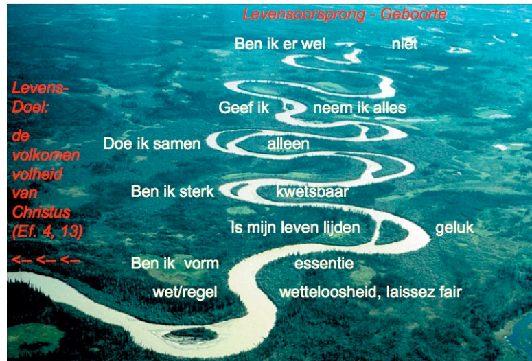
Gedurende de Stroom des Levens zijn er tal van spannende momenten, waarop je keuzes moet, kunt maken. Die keuzes hebben vaak verstrekkende gevolgen voor hoe jij je leven verder doet...

Nu is het belangrijk je te realiseren, dat verwarring onveilig voelt... Dus vlucht je in eoa stroomversnelling voor je veiligheid liefst maar de wal op. En dat is volstrekt logisch. Want je wilt leven en niet (eventueel) omkomen in de stroom... Daarom zoek je op basis van eoa oordeel (nl. over wat naar jouw idee in de gegeven omstandigheden veiligheid biedt) je toevlucht op één pool van de polariteit... Je springt op de linker of de rechter oever. En geeft daarmee de beweging ertussen op. Nogmaals, dit is logisch. En in sommige levenssituaties is dit soms ook echt nodig! Om je vege lijf en leven te redden! Maar tegelijk maakt dit je ook onvrij en star, voel je dat? En daar komt nog wat bij (en dat is hier nog belangrijker): je raakt hierdoor uit contact! Je raakt de verbinding met de Levensstroom kwijt. En zo ook echt Leven! Dit is wat Jezus duidelijk maakt in Joh. 8.